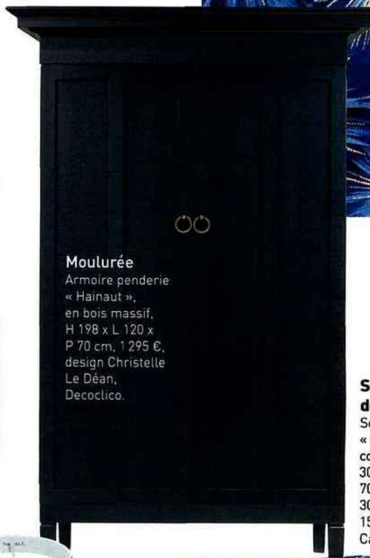
Moulurée Armoire penderie « Hainaut », en bois massif, H 198 x L 120 x P 70 cm, 1.295 €, design Christelle Le Déan, Decoclico.