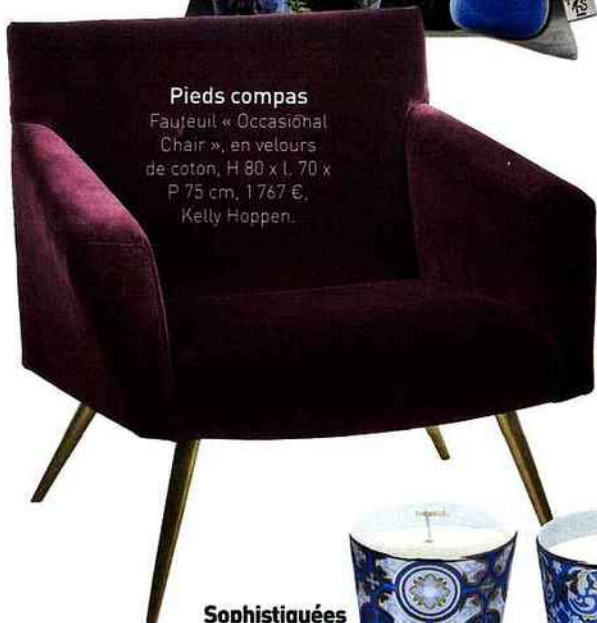
Pieds compas Faujeuil « Occasional Chair », en velours de coton, H 80 x L 70 x P 75 cm, 1.767 €, Kelly Hoppen.