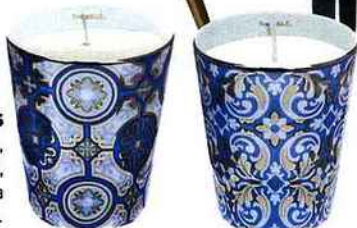
Sophistiquées Timbales « Casteu » et « Oustau », en porcelaine fine de Limoges, H 9,5 cm, 100 € la timbale et 35 € la bougie parfumée, Rose et Marius.