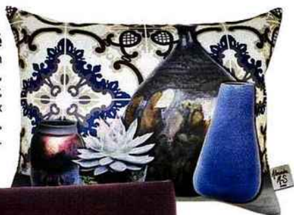
Imagé Coussin « Kéramos », en polyester, dos en lin, 30 x 40 cm, 42 €, Alexandre M-S.