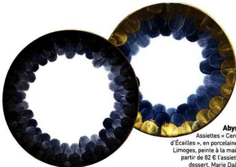
Abysses Assiettes « Cercles d'Écailles », en porcelaine de Limoges, peinte à la main, à partir de 82 € l'assiette à dessert, Marie Daâge.